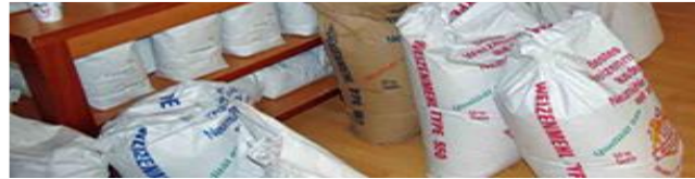
Mehl auch für die Gastronomie und Pizzerien.