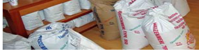
Mehl auch für die Gastronomie und Pizzerien.